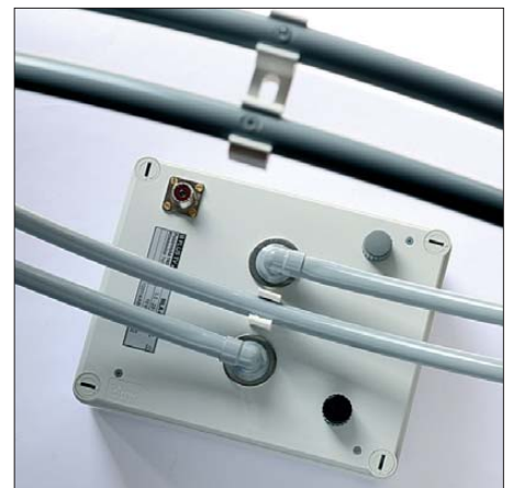
Bild 2: Der Rahmen mit seinen beiden Windungen fußt in einem Kunststoffgehäuse mit 50-Ω-Antennenbuchse und zwei Drehkondensatoren zur Abstimmung.

Die Antennenmontage auf einem Neigekopf hat den Vorteil, dass man die komplette Antenne mitsamt dem zugehörigen Rahmen nun in jede beliebige Lage schwenken kann. Man verändert also nicht mehr nur wie üblich die Himmelsrichtung, sondern bei Bedarf auch die Elevation. In