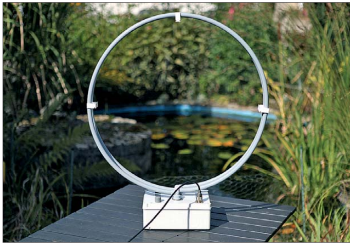
Bild 1: Die MLA-M (Magnetic Loop Antenna - Multiband) ist eine Magnetantenne für den Innenbetrieb oder bei gutem Wetter für den Gartentisch.

Neben dem Antennenrahmen haben auf dem Gehäuse zwei Drehknöpfe ihren Platz, um darüber zwei Drehkondensato-